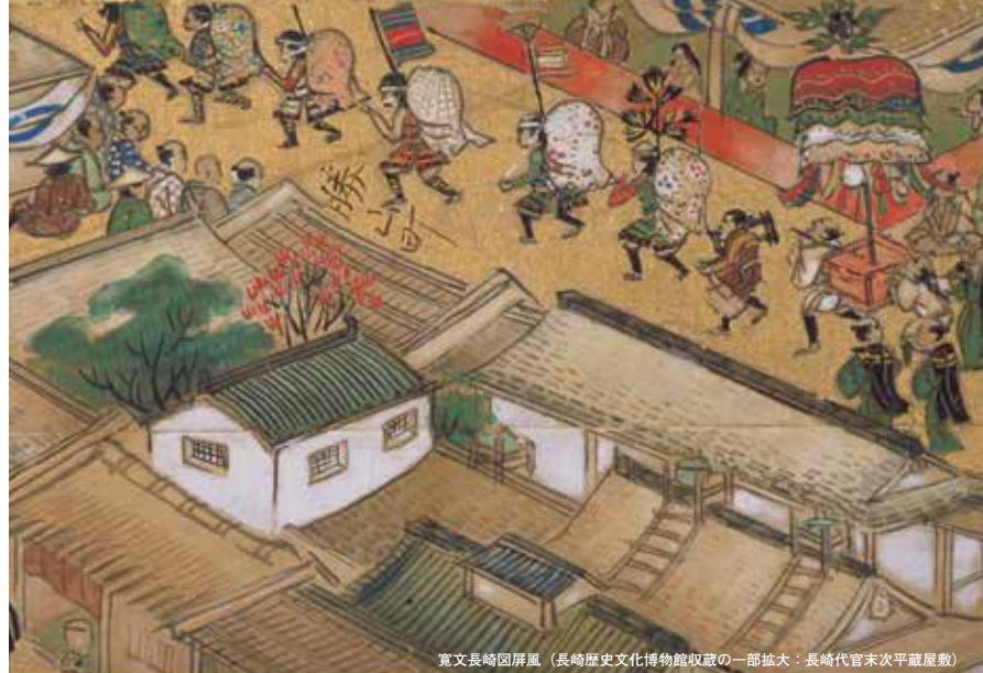
寛文長崎図屏風(長崎歴史文化博物館収蔵の一部拡大:長崎代官末次平蔵屋敷)