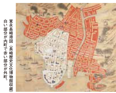
寛永長崎港図(長崎歴史文化博物館収蔵) 白い部分が内町で赤い部分が外町。

江戸時代の長崎には、地租が免除された内町(二十六カ町)と免除外の外町(五十四カ町)がありました。元禄十一年(一六九〇)その区別が廃止されると、長崎八十カ町は奉行が支配、代官は、長崎村、浦上村の三カ村を、後には古賀村など七カ村を併せて支配しました。